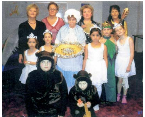
Die kleinen Künstler und ihre Helfer vom Sozialpark MOL